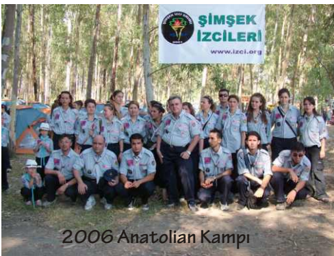
2006 Anatolian Kampı

2004 Dünya Moot'u - Tayvan 2004 Anatolia - 2004 2005 Eurojam İngiltere 2006 Rowerway İtalya 2006 Anatolia - 2006 2007 Dünya Jamboreesi İngiltere 2008 Anadolu 2008 2008 Dünya Gençlik Forumu Çanakkale Kampları Meclis kampları Sakarya Kampları