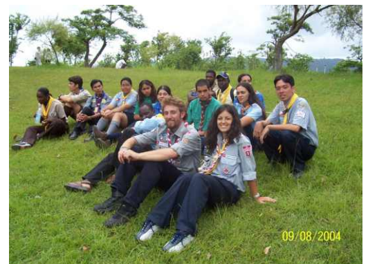
Tayvan Moot 2004

İzcilik, gence hayatı boyunca ihtiyacı olan sağlam karakter yapısını kazandıran bir eğitim metodudur. Herhangi bir sosyal etkinlik gence sadece ilgili alan hakkında kabiliyetler kazandırırken, izcilik gence bütün hayatında kullanacağı sosyal ve kişisel beceriler kazandırmaktadır. İzcilik sayesinde kişisel gelişimimde birçok açıdan olumlu beceriler kazandığıma inanıyorum. Bunlar arasında iletişim